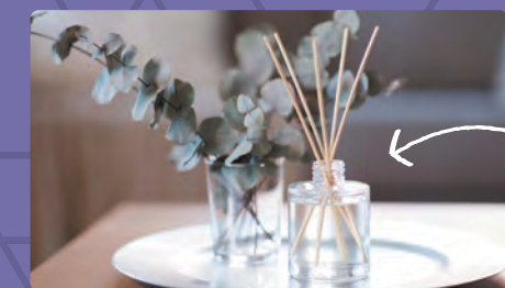
リードディフューザー

ので、据え置き型のリードディフューザーやストーンディフューザーがおすすめ。シューズボックスの上などに置くだけでインテリアとしても見栄えがして、価格も1000円以下からと手軽、まさに一石二鳥です。